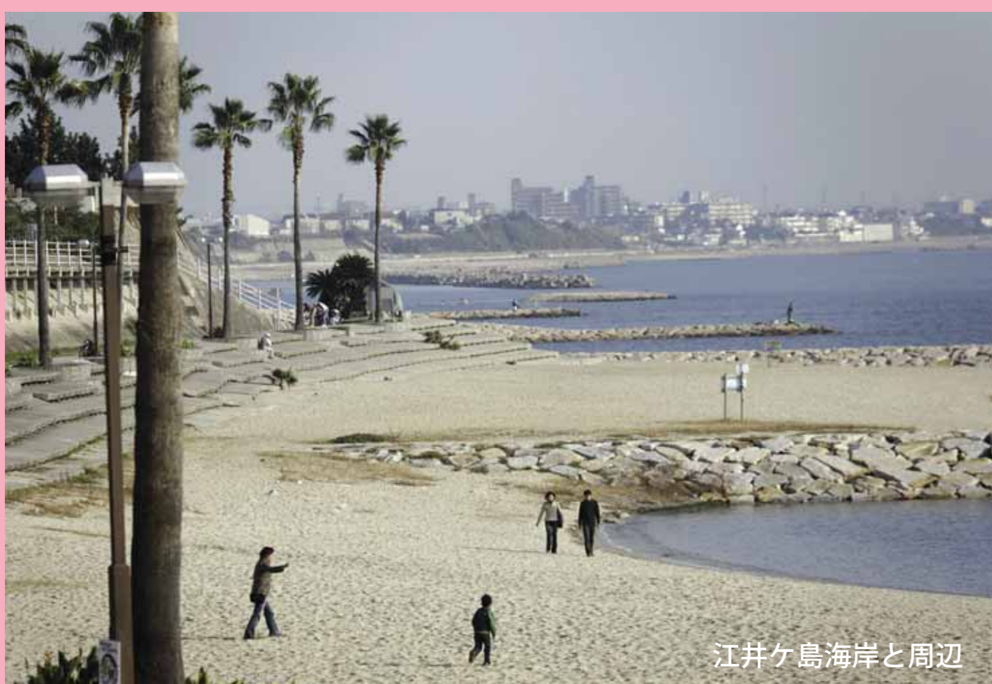
江井ヶ島海岸と周辺