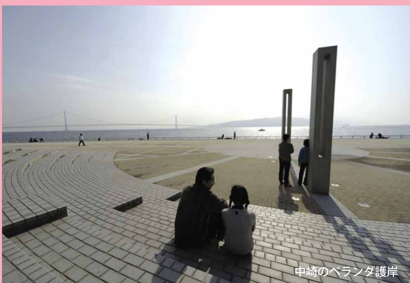
中崎のベランダ護岸