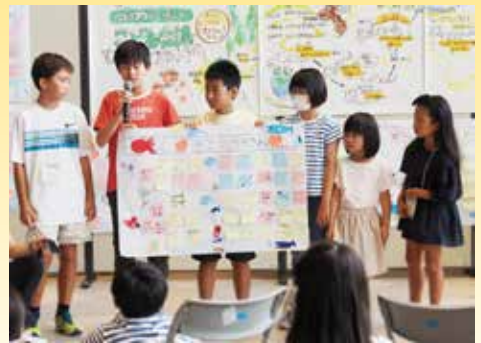
「こども会議」で明石の未来を話し合う小・中学生 (第4回)

申し込み 9月29日(金)までに、①~③のいずれかの 方法で、市民とつながる課(下記)へ