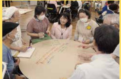
テーブルを囲んで和やかな雰囲気 (第3回)