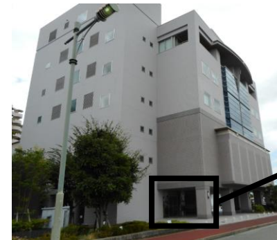
⑤2つ目の建物が保健所です。