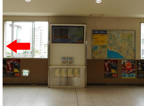
①改札を出たら通路を左へ。