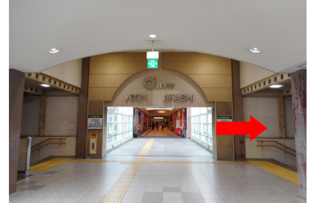
②ピエラ大久保につながる渡り廊下に入る手前で右側の階段へ。