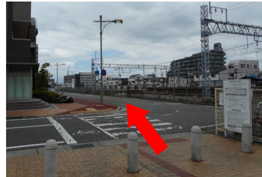
④線路に沿って西に進む。