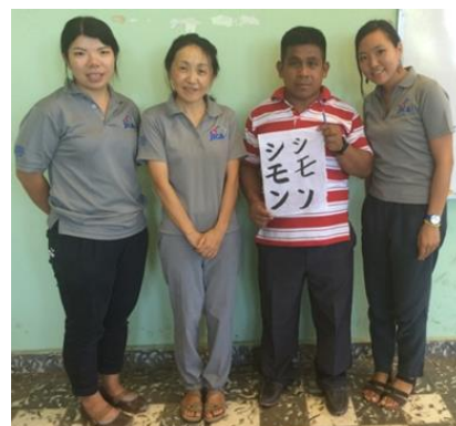
リピーターの教員と♪