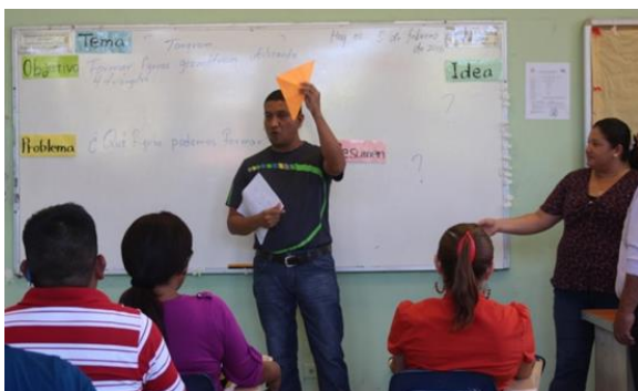
参加教員の模擬授業