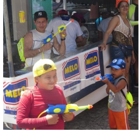
大人も参加の水鉄砲隊