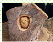
◀ 可愛い木工細工にも 利用できます！