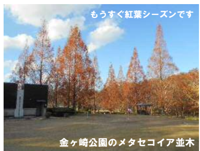
もうすぐ紅葉シーズンです