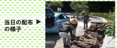
▶ 当日の配布の様子