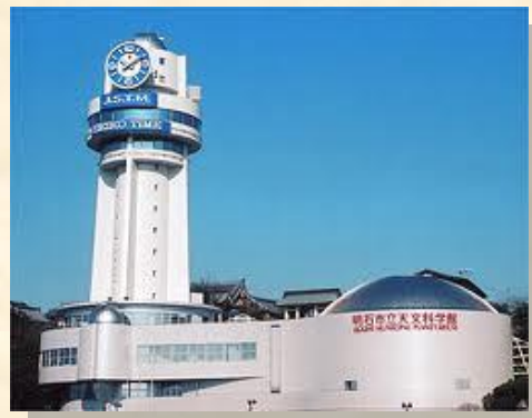
明石市立天文科学館