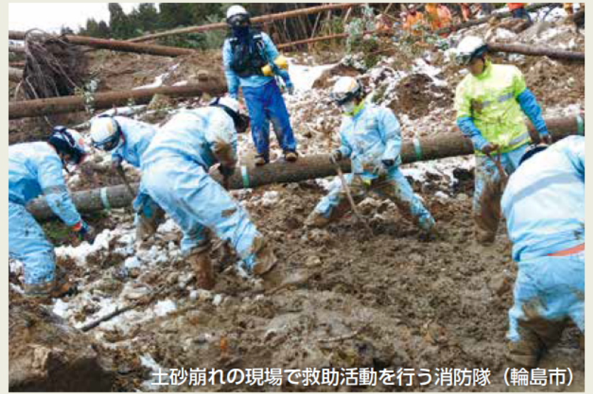
土砂崩れの現場で救助活動を行う消防隊 (輪島市)