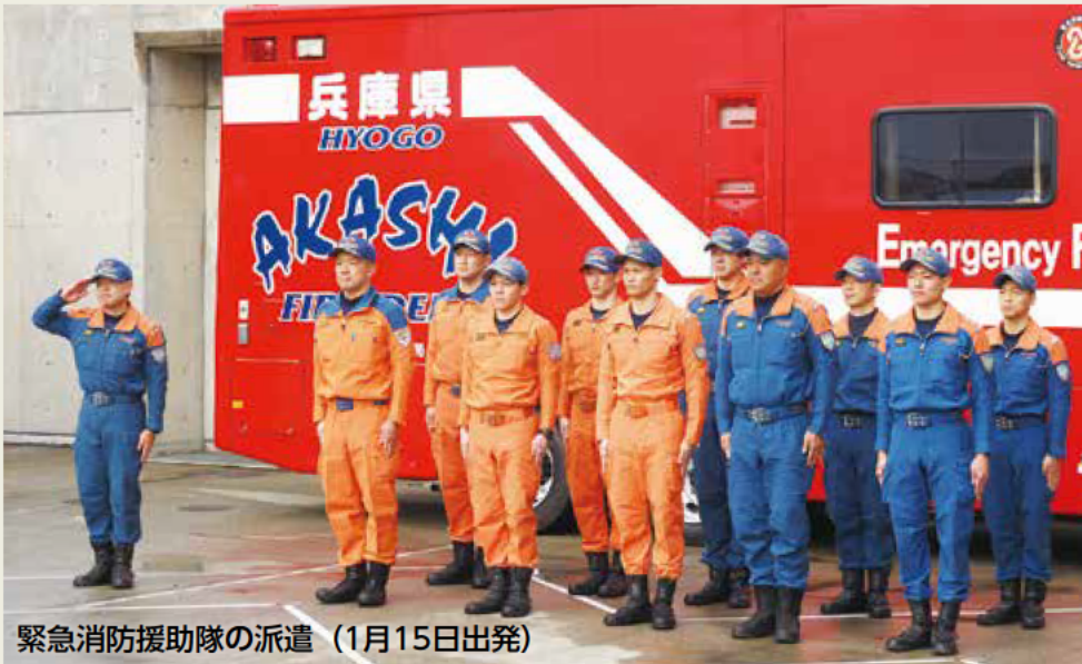
緊急消防援助隊の派遣 (1月15日出発)