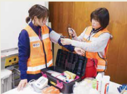
被災者の健康相談に備えて 準備をする保健師