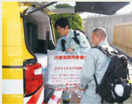
避難所の運営支援へ向かう職員