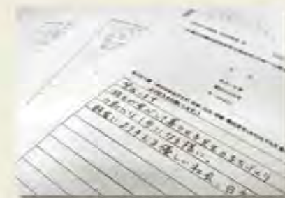
これまでに寄せられた540通のパブリックコメント