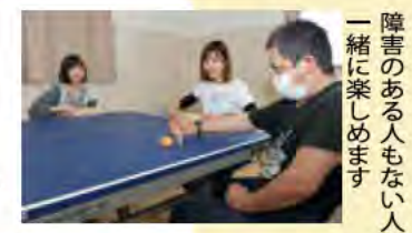
障害のある人もない人も一緒に楽しめます