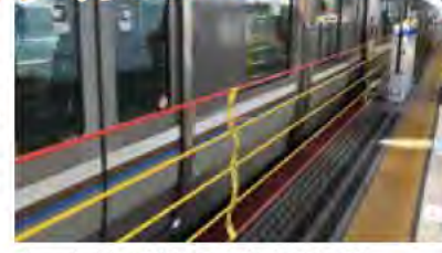
ホームドアが設置された明石駅