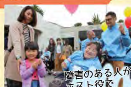
障害のある人がホスト役で来場者をおもてなし