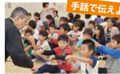
市立小学校の4年生を対象に、耳の聞こえない人の生活や手話を学ぶ「手話体験教室」を実施しています