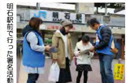
明石駅で行った署名活動

誰もが安全に安心して公共交通を利用できるように市民の皆さんとまちを挙げてホームドアの設置に取り組んできました。