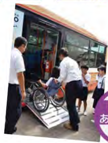
段差はありません