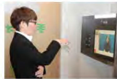
明石の駅前ビル内に自治体で初めて手話フォンが設置されました