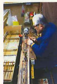
明石市立天文科学館賞「釣り竿師」