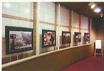
昨年度の展示風景