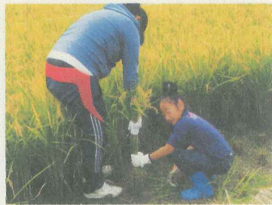
稲刈り③ 恐る恐る えい！