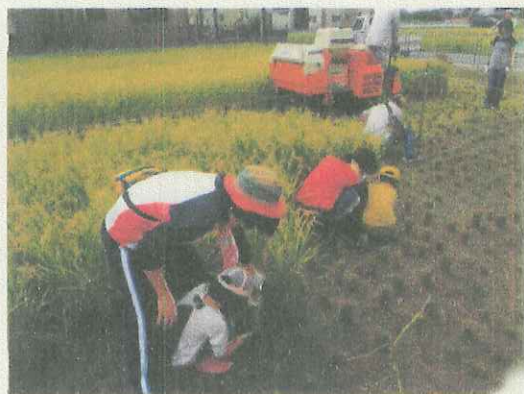
稲刈り④ 手刈りと機械刈り