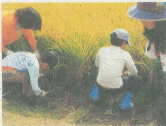
稲刈り② 長靴軍手でけが防止