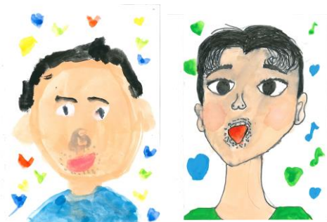
お父さんの似顔絵