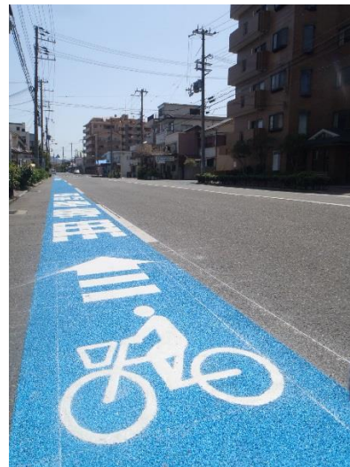
自転車専用通行帯