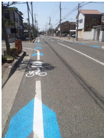
車道混在 (自転車ナビマーク)