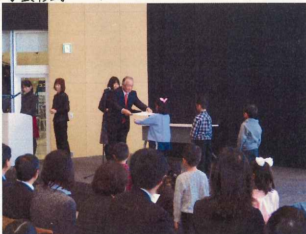
↑教育長から、代表作品受賞者全員に表彰状の授与が行われました。