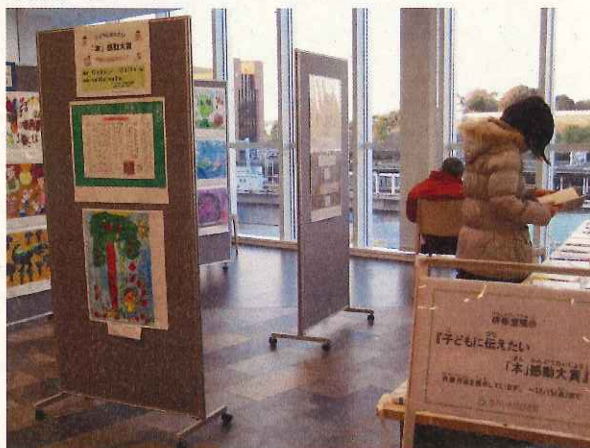
↑明石市立図書館にて代表作品の展示をしました。