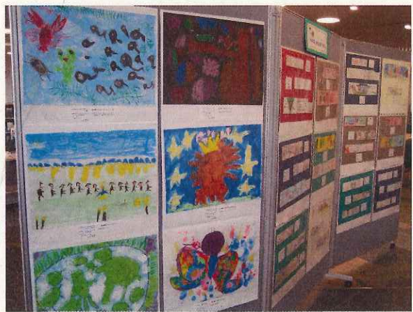
↑作品からは、本を読む楽しさが伝わってきます。