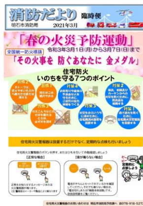
「消防だより」表（左）、裏（右）