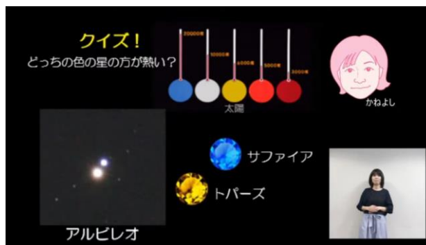
※オンライン観望会の配信映像(2020/7/18)