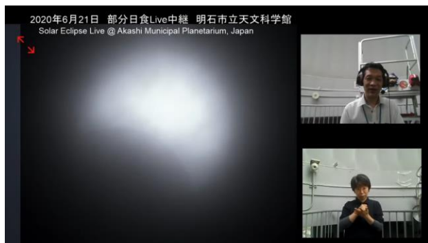
※オンライン観望会の配信映像(2020/6/21)