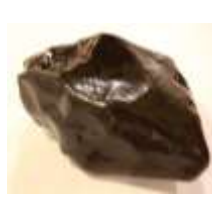
岡野隕石(レプリカ)