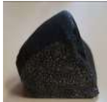
竹内隕石(レプリカ)