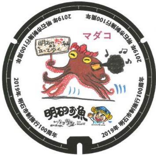
マンホール蓋デザイン例