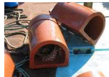
投入予定の産卵用たこつぼ