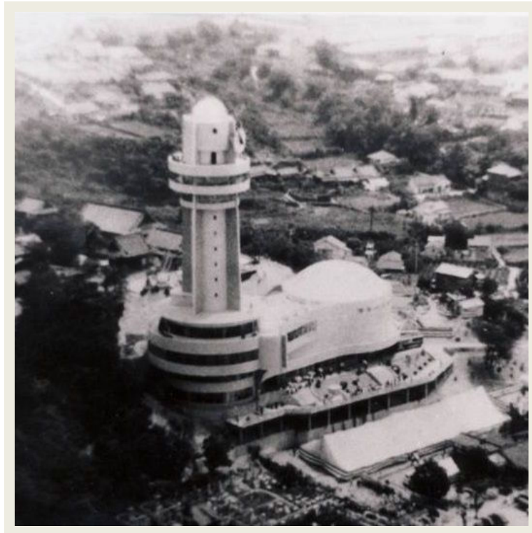
昭和35年、開館当時の天文科学館