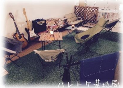
ハレットケ基地局