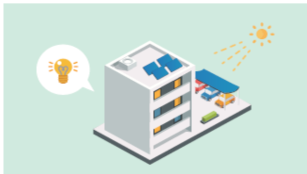
環境省 駐車場を活用したソーラーカーポートの導入についてを元に作成

自家消費型の太陽光発電システムは、建物でのCO 2 削減はもちろんのこと、停電時にも一定の電力使用ができるため防災性の向上にも繋がるものです。