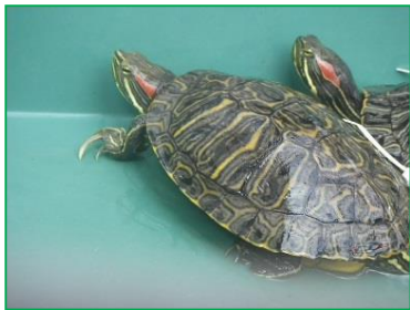
タライでもだいじょうぶ