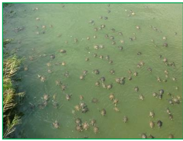
ふえすぎたアカミミガメ