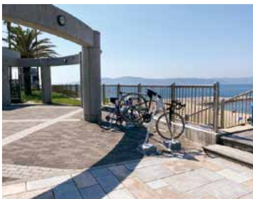
サイクリング環境の向上へ

ない公園などの除草は、市が計画的に行っている。樹木の剪定時期は、樹形や地域の声を踏まえ実施しているが、民地にはみ出した樹木の剪定を求める声もあり、点検を強化するなど改善すべき点があるほか、大木化や老齢化の課題もある。