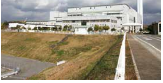
老朽化が進む現在の明石クリーンセンター

問 策定が遅れている新ごみ処理施設整備基本計画の進捗状況と事業費抑制のための取り組みについて聞く。 答 このたび、施設整備の基本的な方針をまとめた新ごみ処理施設整備基本計画(素案)を作成した。 新ごみ処理施設は、整備費削減のため可能な限りコンパクトな施設を