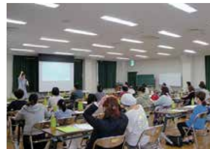
魚住東地区での人権研修会

問 施設整備費約418億円(うち市負担額は約185億円)の根拠となっている見積額は、2019年当時のものだが、物価高騰などの影響はないのか。また、現在予定している2030年度の供用開始に遅れが生