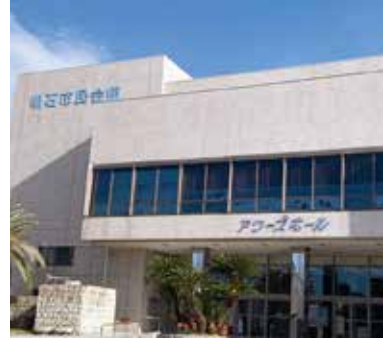
当面は継続使用の予定

を検討している。高校生世代とは、16歳になる年度の4月から18歳になる年度の3月まで、就職・高校中退などで高校に通っていない人も含む。対象者は約8100人で、年間約4億8千万円の予算が必要である。財源は、基金を取り崩しても確保し、実施したい。本来は国が制度化するべきと考えているが、国の制度化を待たずに始めたい。