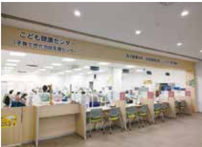
妊婦面談を行う子ども健康センター

答 生後3カ月までの実態把握ができていない。引き続き、妊娠前から一貫しての支援に取り組んでいく。