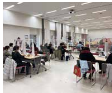
みんなで脳力アップ教室

講を企業や学校等に働きかけている。さらに、認知症カフェの運営や養成講座のスタッフなどとして活動する地域支援サポーターの養成を進めている。昨年7月からは、認知症の人の社会参加につながる取り組みも始めた。