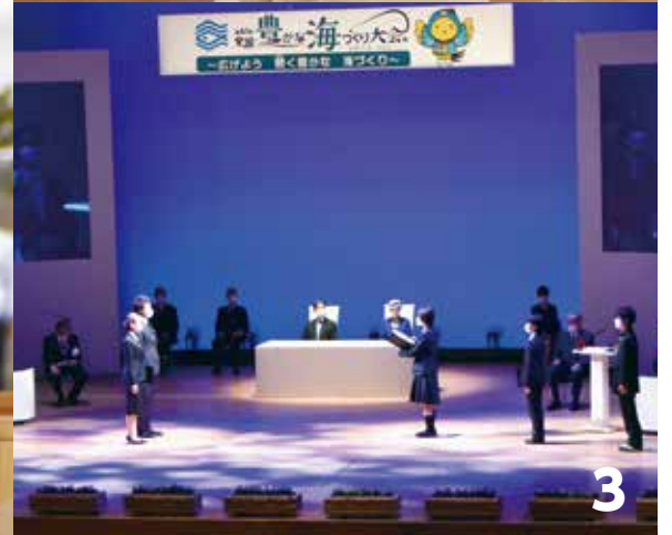
1 稚魚を放流される両陛下 2 天皇陛下から明石市漁業組合連合会の大西会長にノリの種が手渡される 3 漁業後継者と高校生が豊かな あお 海の未来を誓う