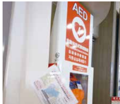
ためらわない使用が命を救う

答 女性にAEDのパッドを装着する際、抵抗を感じている人がいるが、命を救うためには、ためらわずに使用することが重要である。市民救命士講習では、人垣を作り周囲から見えないようにすることやパッド装着後に服などを掛けることなど、AEDの使用を優先する方法を指導している。