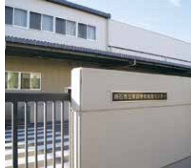
質と量は維持(東部学校給食センター)

相当分として、1食当たり小学校で29円、中学校で30円を公費負担し、保護者の負担軽減を図ってきた。当面、食材価格は今の状況が続くと予