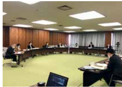
明石市ジェンダー平等の実現に関する検討会