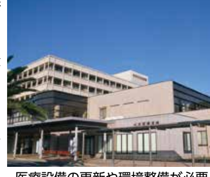
医療設備の更新や環境整備が必要

を行うとあり、建て替えを意味するものと理解する。市民病院の建て替えに関する市長の認識を問う。