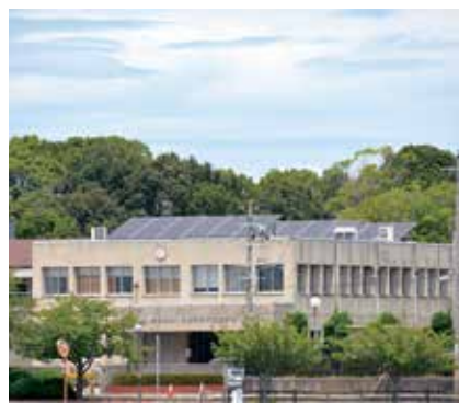
在籍者が急増するいなみ野特別支援学校

答 県は、知的障害児を対象とする特別支援学校を令和4年に西宮市に開校した。6年には川西市に開校し、その後は東播磨地域にも開校予定と聞いている。3年夏ごろに、県から市教育委員会に対し、1万平方メートル