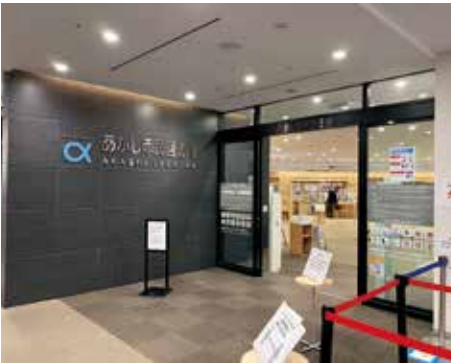
市内の図書館を5館へ増設

議会です3館を新設する道筋をつけたい。西明石は、サンライフ明石の中に地域交流拠点に合わせて西部図書館を超える蔵書数の図書館を国庫補助とJR西日本の協力により市の負担なしに整備する。大久保は、JR大久保駅南のロータリーを縮小し、図書館