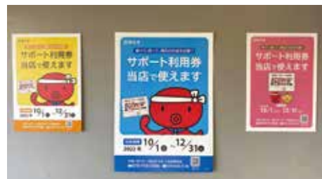
市民の暮らしと地域経済を守る

原油価格や物価の高騰に直面している市民の暮らしを守り、市内の経済活動を支えるために実施している。1人3千円のサポート利用券を令和4年9月下旬から世帯ごとによゆうパックで配達しており、約98%の市民に届いている。長期不在等で届けられなかった利用券は、市役所の開庁時間だけでなく、夜間や土日にも窓口を開け、多くの市民が受け取れるよう努めている。利用できる店舗は、事業開始当時から大幅に増