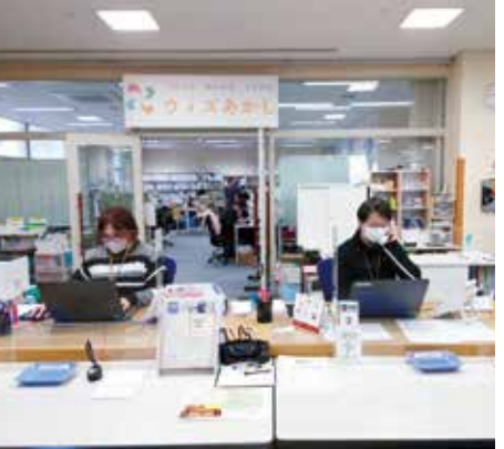
市民活動支援センター(ウィズあかし内)

問 や団体間のコーディネート機能などを持ち、幅広い年代の市民が利用しており、平成29年4月に、従来の機能を充実させる形で、アスパア明石内の複合型交流拠点ウィズあかしの中に設置した。 新たなセンターの設置は、場所の確保やスキルを持つ人材の配置などの課題がある。市内の中西部地域に設置を望む声があるため、