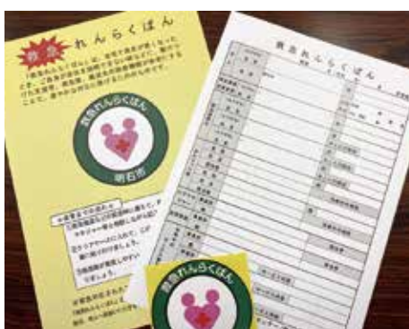
速やかな対応につなげる

問 救急れんらくばんは、1人暮らし高齢者を中心に令和4年11月時点で8500人に配布されている。その運用状況と配布対象を拡大する考えがないか、市の見解を聞く。