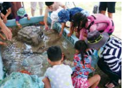
お魚タッチプール (大蔵海岸公園)

答 同事業者は、プロスポーツ選手とのつながりがあるため、選手を招いたイベントやスポーツ教室を行って