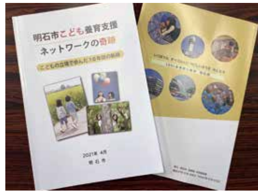
子どもの成長を応援する

2014年から離婚後の子ども養育支援を開始し、子どもの立場に立ち面会交流のコーディネート