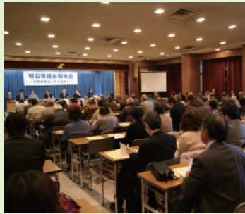
多くの市民が参加した(商工会議所)