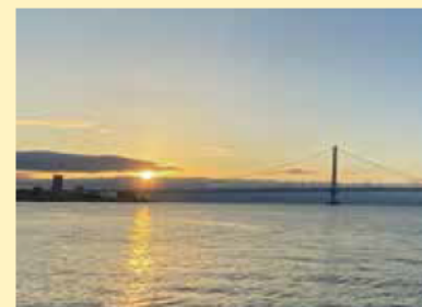
明石海峡大橋と朝日

大蔵海岸公園が、NPO法人日本列島夕陽と朝日の郷づくり協会主催の「日本の夕陽・朝日百選」に認定されました。また、「朝日百選」の認定は県内初になります。