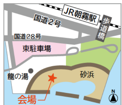
JR朝霧駅から徒歩約2分(駐車場あり)

どんなふう遊ぶかはみんな次第。新しい遊びを作り出すこともできます。自由な発想で、明石の自然と触れ合ってみませんか。 お問い合わせ/公園・海岸課 (TEL)918-5039 (FAX)918-5109