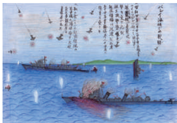
戦争体験を記した絵日記 平成15年 個人蔵

期間/7月5日(日)まで 午前9時30分～午後5時30分(入館は午後5時まで) ※月曜休館 観覧料/大人200円、大高生150円(中学生以下無料)、障害者手帳などの提示で半額