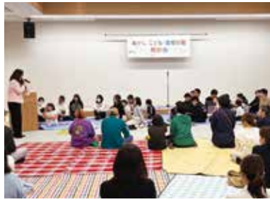
こども・若者会議の意見を反映

答 同計画は、こども・若者会議の意見に加え、学校等のワークショップ、オンライン等で集めた約1万7千件の声をもとに策定した。他市のように具体的な施策を全て1冊にまとめる手法もあるが、本市は子どもの声を核とし