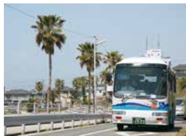
たこバスの利用者数は年々増加

し路線バス運行地域で も休止や減便が相次ぐ など、さまざまな課題 があると認識している。 問題解決には新たな 地域コミュニティ交通 や住民主体のポランテ ィア交通等の検討が必 要である。魚住地域で は住民主体の助け合い 組織を立ち上げ、支援 が必要な人の通院補助 や買い物支援等、移動 に関する取り組みを実 施している。今後も引 き続き、他都市の先進