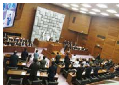
賛成多数で修正案を可決

3月25日の本会議では、明石駅周辺地区整備事業の費用のうち旧市立図書館の解体工事費以外を削除した令和8年度明石市一般会計予算の修正案を賛成多数で可決しました。明石駅周辺地区整備事業は、国の補助金を活用して財政負担の抑制を図るため、明石駅南側の歩行者空間整備と旧市立図書館解体後の（仮称）地域交流センターの整備を合わせて行うものです。