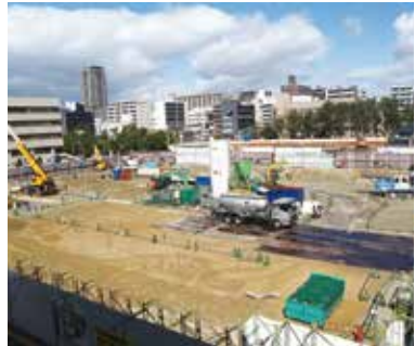
工事が始まった市役所新庁舎

祉費等の扶助費が増加したことにより過去最大の1515億円となっている。今後は新庁舎やごみ処理施設等の整備に伴い借入れれる市債の償還が本格化する12年度ごろから収支不足が発生する見込みで、財政収支の均衡を図る必要がある。そのため、歳入確保に向けた強化策として新たに財政戦略担当を設置し、ふるさと納税の獲得強化やネーミングライツの拡充、歳入確保に関する先進事例の収集等に取り組む。さらに、歳出面においても公共施設の配置適正化や事務事業の見直し等、事業の選択と集中を図り、限りある財源を最大限活用していく。今後も収支見込みの改善を