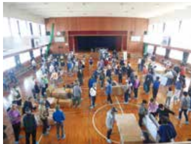
避難所となる体育館で防災訓練

答 南海トラフ地震で津波等の被害が予想される沿岸部地域の藤江、二見、谷八木では、令和4年度から地域の人が避難所までの経路を確認するとともに避難所運営を体験することにより地域防災力の向上に取り組んでいる。津波の警戒が必要な標高3メートル以下に避難所がある林、中崎小学校区は、他校区に避難する必要があるため、避難場所や避難経路の確認、隣接する校区での防災訓練を検討