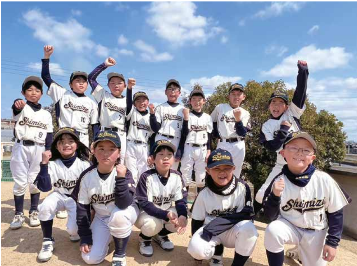
青空の下、ソフトボール大会に参加した子どもたち（清水小学校運動場）

令和8年第1回定例会3月議会が2月19日から3月25日まで開かれました。明石市国民健康保険条例の一部を改正する条例制定のことや、固定資産評価審査委員会委員選任の人事案件など、議案43件を可決・同意、令和8年度明石市一般会計予算議案1件を修正可決、報告5件を了承しました。