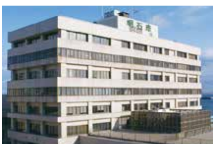
国の交付金を活用し物価高騰対策

対象者は、令和8年5月1日時点で市内に住民登録がある19歳以上の人で、世帯主に対し、対象人数分の合計額をチャージしたプリペイド式ギフトカード1枚を8月ごろから発送する予定です。利用期間は11月末までとしており、全国のVisa加盟店750万店舗に加え、インターネットショッピングでの利用も可能です。利用方法は今後、市から丁寧に周知することとしています。