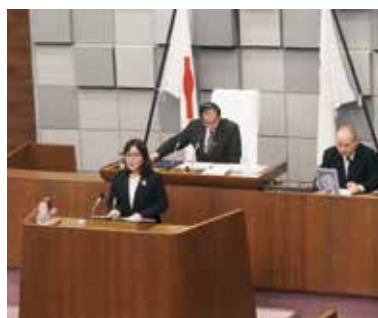
施政方針を述べる丸谷市長

経費や扶助費の増加等により、7年度から149億円増加した。財政基金等3基金の取り崩し額は29億円だが、8年度末の残高は122億円を確保できる見込みで、実質公債費比率などの財政指標は健全な水準を維持している。収支見込み上の基金残高も15年度末時点では7年度から9億円改善し、94億円となる見込みだ。 今後、財政運営指針となる財政白書の15年度末時点での基金残高100億円維持を目標に、歳入面では、ふるさと納税の獲得強化や公共施設のネーミングライツの拡充など自主財源の確保に努め、歳出面では、公共施設の配置適正化のほか事業の選択と集中を