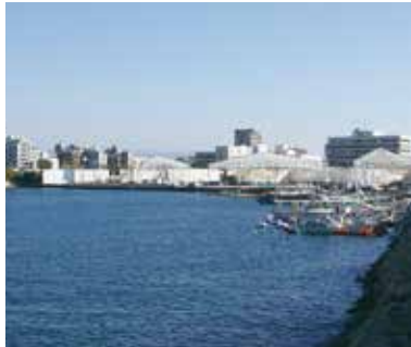
にぎわいづくりの要となる明石港東外港地区

石駅周辺地区、明石港東外港地区、大蔵海岸地区が相互に連携して取り組むことが明石のまちの魅力や回遊性を高め、さらなるにぎわいの創出につながるのと提言があった。本市としても、L字型を描く3地区を軸としたまちづくりは重要と認識している。特に県管理の港湾施設用地である東外港地区は、明石公園、明石駅、中心商業地のラインと大蔵海岸をつなぐ要に位置する重要な場所であり、市庁舎跡地との一体的な利活用に向け、県と連携して取り組みを進めたい。なお、令和7年9月に県と明石港東外港地区再開発推進に関する基本協定書を締結し、県有地と市有地の一体