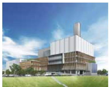
完成予想図 (外観イメージ)

施設の安定稼働と安全性を確保していく。今後も継続的な情報公開と住民理解の促進のため、工事の進捗よく状況、事業者からの提案内容等を市ホームページなどで市民に丁寧に報告していく。 ○その他の項目 ○令和8年度予算編成方針と市政運営の基本姿勢