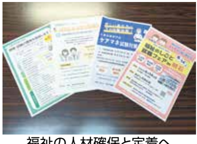
福祉の人材確保と定着へ