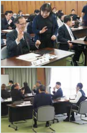
手話に挑戦 (議員研修風景)

令和7年6月、手話の習得、使用、普及・促進の3つの柱を掲げた、手話施策推進法(手話に関する施策の推進に関する法律)が施行され、自治体の責務として、普及・促進の環境整備が位置付けられました。 まずは、市議会議員が率先して、手話を習得、使用できるよう、今年2月、全議員を対象に、手話研修を実施しました。 クイズ形式で手話の基礎知識を学ぶとともに自己紹介、得意なことや苦手なことを手話で伝えるなど、体の動きや表情を使う手話表現を学び、手話の理解を深める貴重な機会となりました。 市議会として、引き続き市民への普及、推進につながる環境整備に尽力してまいります。