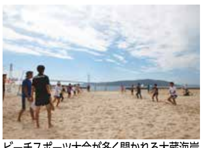
ビーチスポーツ大会が多く開かれる大蔵海岸