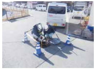
定期的な点検で市民生活を守る

問 全国的に水道管の破 裂事故による断水や老 朽化した下水道管が原 因の道路陥没が発生し ているが、市の現状は、