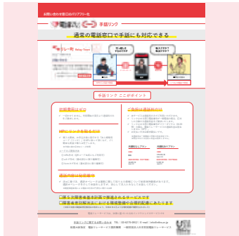
手話リンクの周知・啓発へ

事業の検討に向け、市内や近隣市町、約200カ所の訪問看護ステーションに医療的ケア児等の受け入れ状況の調査を行い、約20カ所から対応可能との回答を得た。一方、家族と事業所のマッチングに課題もあることから、今後はそれらを踏まえ、家族の負担軽減を図るため制度導入へ具体的に取り組んでいく。