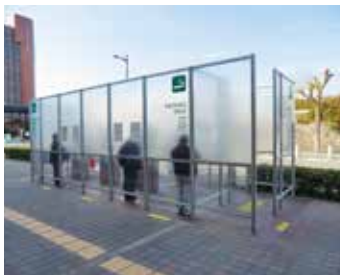
JR明石駅北側の喫煙所

的・予防的調査として血液検査を実施する予定はないのか。 このため疫学的・予防的調査を目的とした血液検査の実施は現時点では考えていないが、既存統計データを用いた健康状態把握の研究について検討している。今後は国の動向を注視し適時適切な情報提供に努め、健康状態把握のため健康診査等の受診率向上に取り組む。