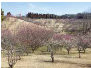
市民の憩いの場(石ヶ谷公園の梅林)

たことからの引き続き 資格取得を目指す人へ の支援を行う。 人材育成の取り組み として、7年度は市内 事業所の新人・若手職 員を対象に研修を行っ た。8年度は中堅職員 と全階層対象のきめ細 やかな研修を追加す ることにより、事業所間 の垣根を越えた交流の 機会を創出し、やりが いを持って働ける環境 整備に努めていきたい。