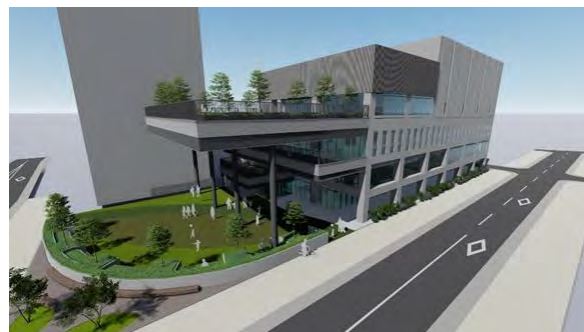
icotto（いこっと）のイメージ