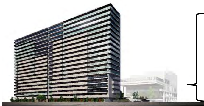
新築分譲マンションのイメージ

西明石地域交流センターicotto（いこっと）については、2027年夏頃の開館を目指して建設工事を進めています。隣接地で新築分譲マンションの建設工事も進んでおり、西明石地域交流センターと同時期の2027年夏頃の完成を目指しています。