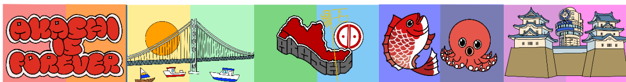
① ② ③ ④ ⑤