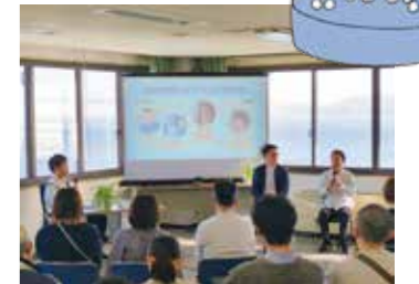
「地域課題 × ビジネス」について語りあう (第1回の共創カフェ)

さまざまな知見を持った企業や教育機関などと行政が連携して、地域課題の解決のために取り組みを進めていきます。