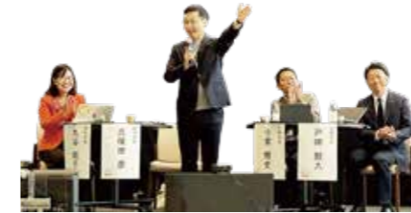
対話と共創のまちづくり首長サミット in あかし