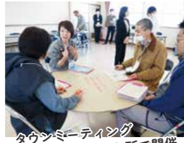
タウンミーティング 地域編も13か所で開催