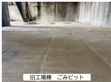
① 洗浄水浸透防止対策