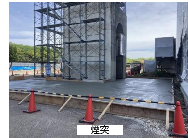
③ 煙道部分撤去 前室土間工事状況