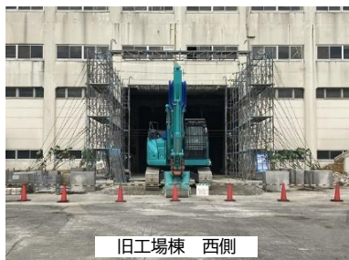
④ 重機等搬入前室 養生足場組立状況