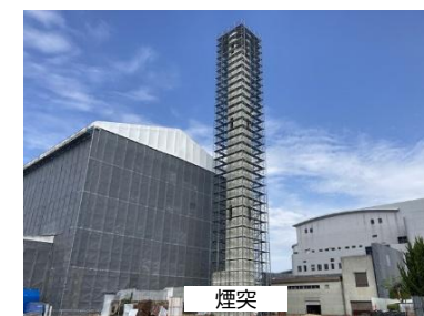
⑥ 外部養生足場 設置状況