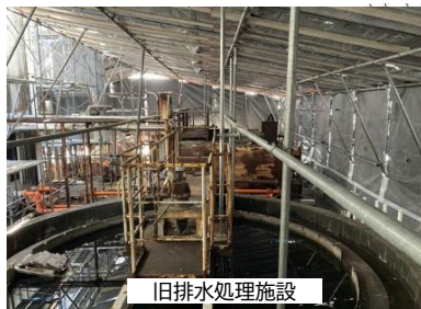
② 外部養生足場 密閉養生状況