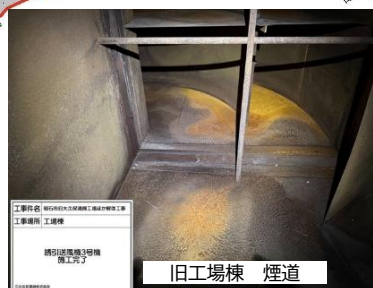
⑤ 誘引送風路 (煙道) 洗浄完了状況