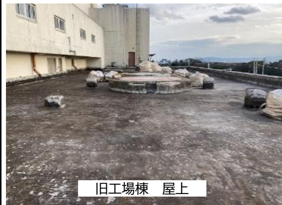
①嵩上げコンクリート アスファルト防水 撤去状況