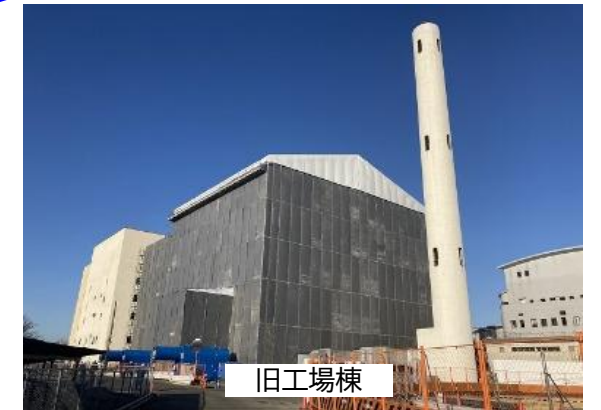
⑦外部養生足場 テント屋根 設置状況