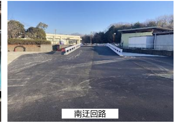
④構内道路 工事完了