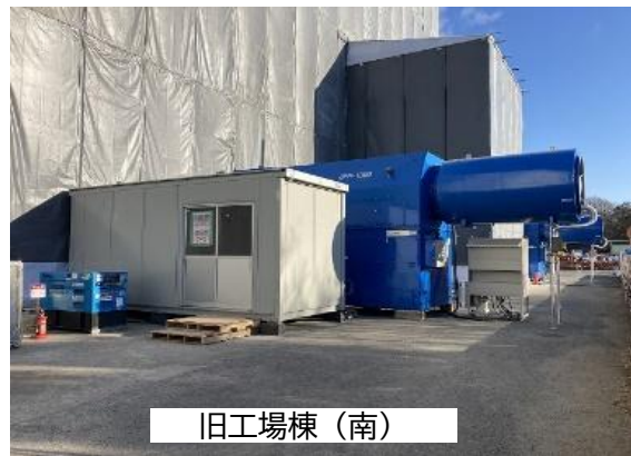
⑤クリーンルーム 集じん機 設置状況