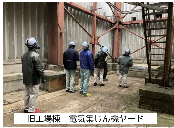
②ダイオキシン類除染前 密閉養生 確認状況