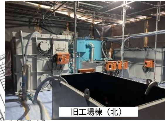
③水処理施設 設置状況