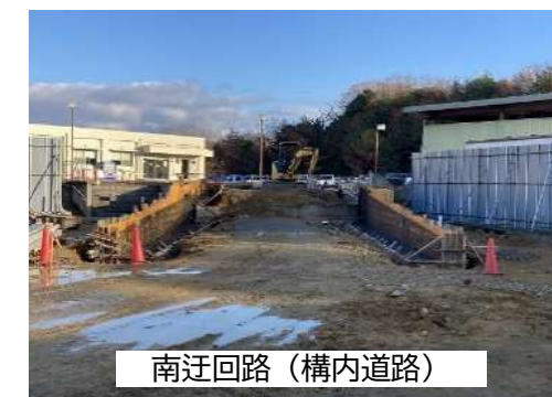
南迂回路（構内道路）