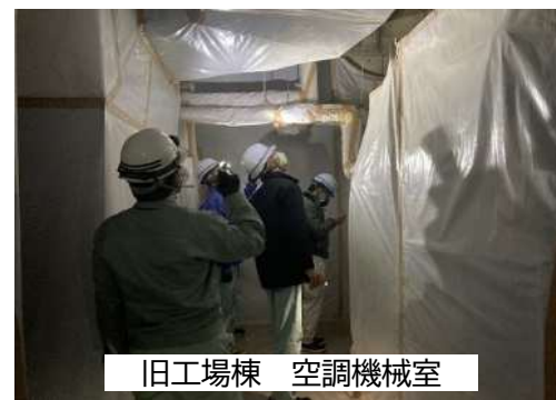
旧工場棟 空調機械室