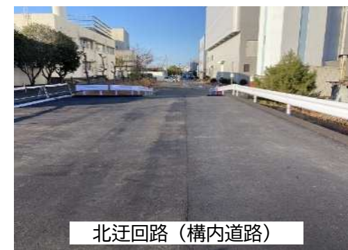
北迂回路（構内道路）