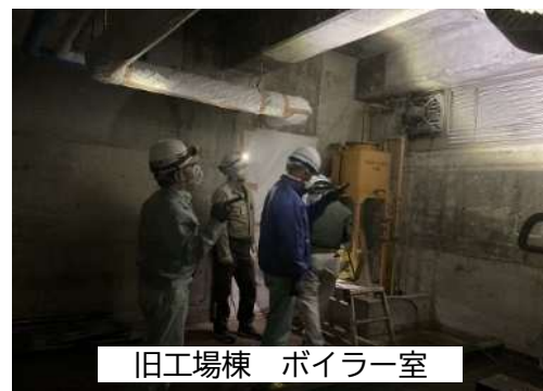
旧工場棟 ボイラー室