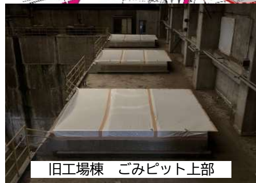
旧工場棟 ごみピット上部