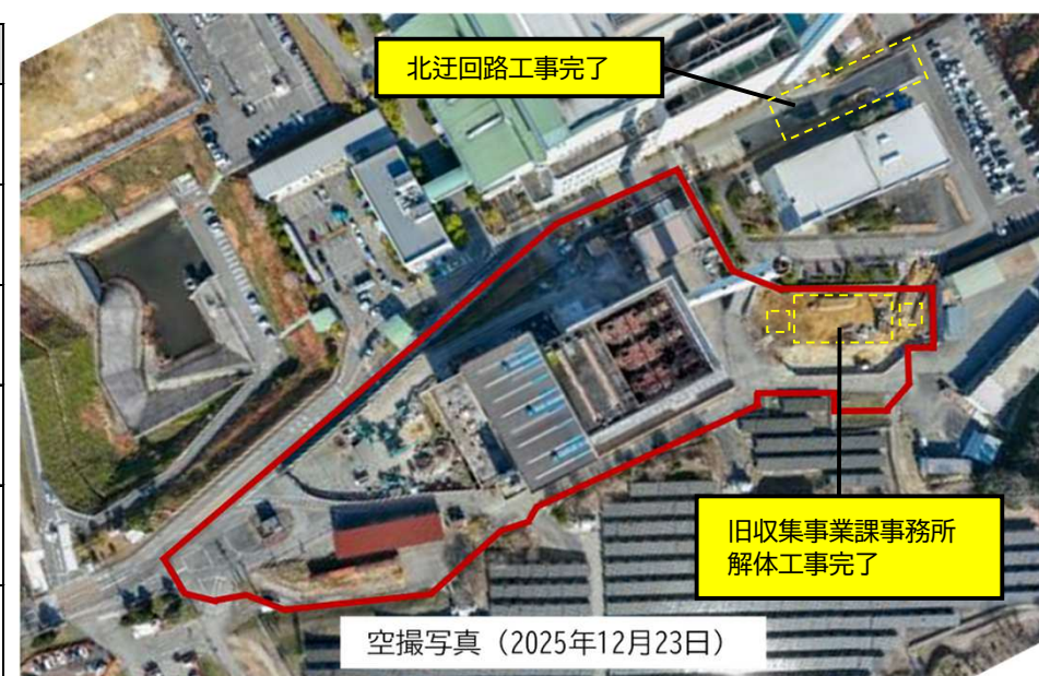
北迂回路工事完了