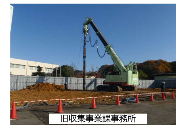
旧収集事業課事務所