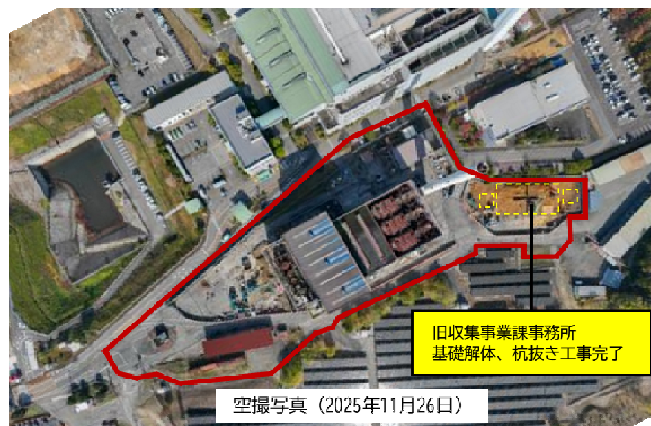
旧収集事業課事務所 基礎解体、杭抜き工事完了