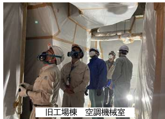
旧工場棟 空調機械室