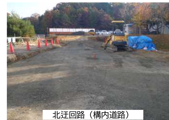
北迂回路（構内道路）