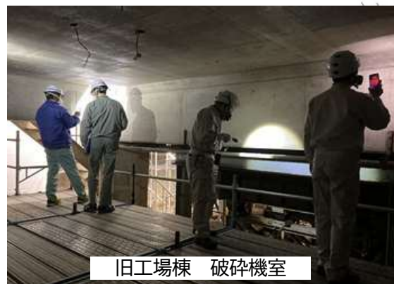
旧工場棟 破碎機室