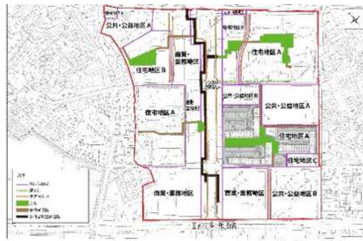
景観重点地区（大久保駅南地区）区域図