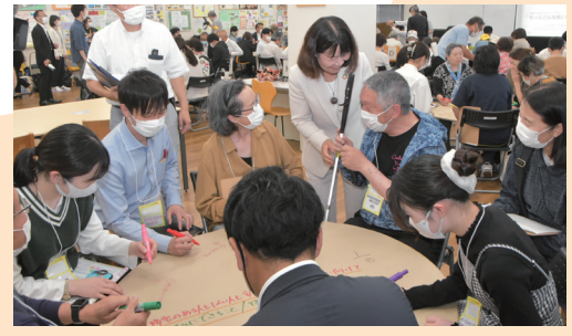
テーブルを囲んで和やかな雰囲気です（第1回）

いつまでも安心して自分らしく暮らし続けるために、私たちができること、行政と一緒に進めたいことをみんなで考えてみませんか。