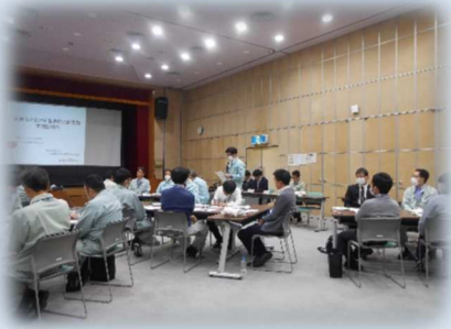
土木部会による研修会