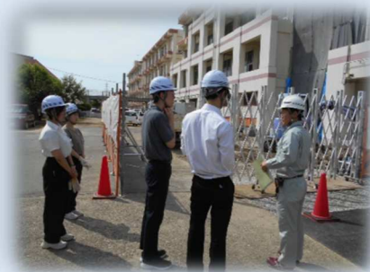
1day 職場体験会 (市役所の技術職の業務内容を紹介)