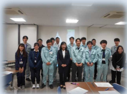
若手技術職員交流会

技術職員の能力開発や職種間の 連携と促進を深めるために 技術職員でつくる組織があるよ！