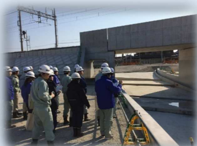
現場での実地研修会