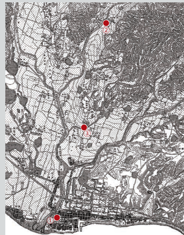
『源氏物語』文学遺跡と伝説の地 ①:浜の館 ②:岡の館 ③:恋の橋

このような忠国による文学遺跡の見立てが、物語の流行とともに、広まり、『源氏物語』ゆかりや伝説の地が多く生み出され、現在に伝えられている。