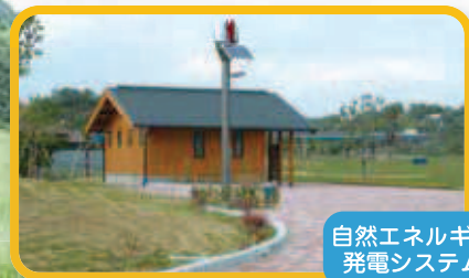
自然エネルギー 発電システム