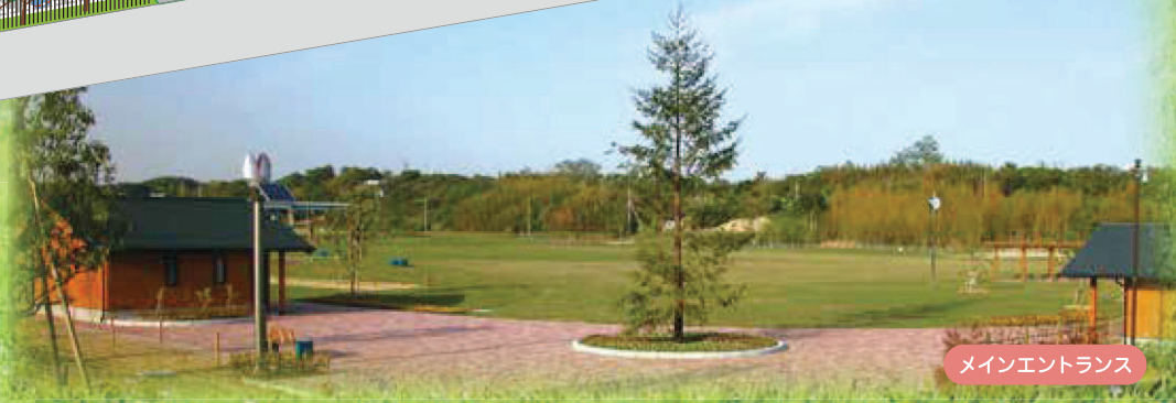
メインエントランス