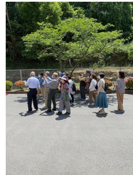
「誰でも簡単！スマホでもできるちょっといい写真の撮り方」