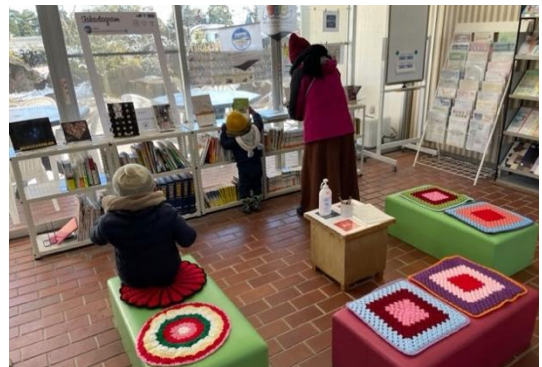
自由に読書や本が借りられる図書スペース