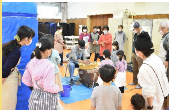
コミセン主催事業での体験教室の実施

コミセン内や地域での講座などで、指導者だけでなくサークルのメンバーが先生となって学びを提供している取り組みが増えています。