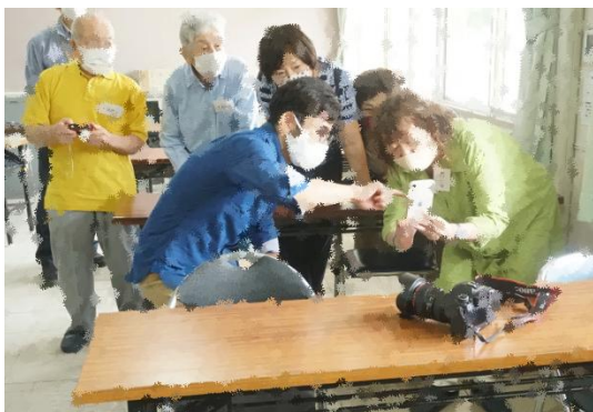
プロから写真の取り方を学ぶ市民講座