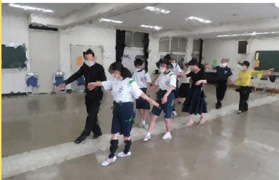
スポーツ系サークルと中学校との連携

中学校コミセンならではの取り組みで、トライやるウィークの受け入れや学校のクラブ活動と練習連携をするなど、子どもたちへの学びにも貢献しています。