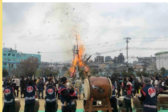
文化系サークルの地域イベントでの演奏

サークルで学んだ知識や経験を、自分たちのものだけにするのではなく、地域のまつりや福祉施設などへの慰問活動で音楽演奏、演舞披露を行うこともできます。