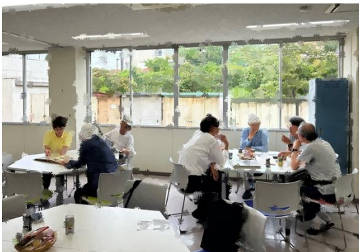
フリースペースでの交流