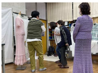
目を凝らして鑑賞