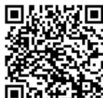
▲高丘コミセン公式LINE