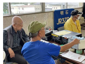
高丘コミセン アマチュア無線クラブ