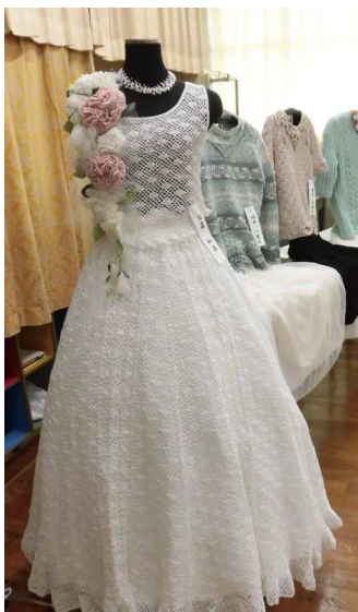
手編みのウェディングドレス

登録サークルは、体育館18、中央集会所23。 10月10日から11月5日まで登録サークルの一日体験見学会を開催しました。 今後も見学・体験希望の場合は、随時活動日、活動場所へお越しください。また、オカリナ、ハーモニカ、健康体操、書道、絵手紙、絵画、着物リメイク、フラダンスなどの一般サークルも随時活動されています。