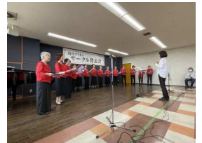
高丘女声コーラス