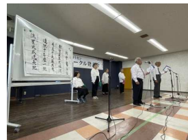
高丘詩吟サークル