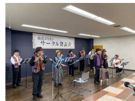
フォークローレサークル グループ・アルト