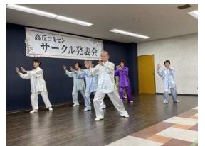
健康太極拳倶楽部