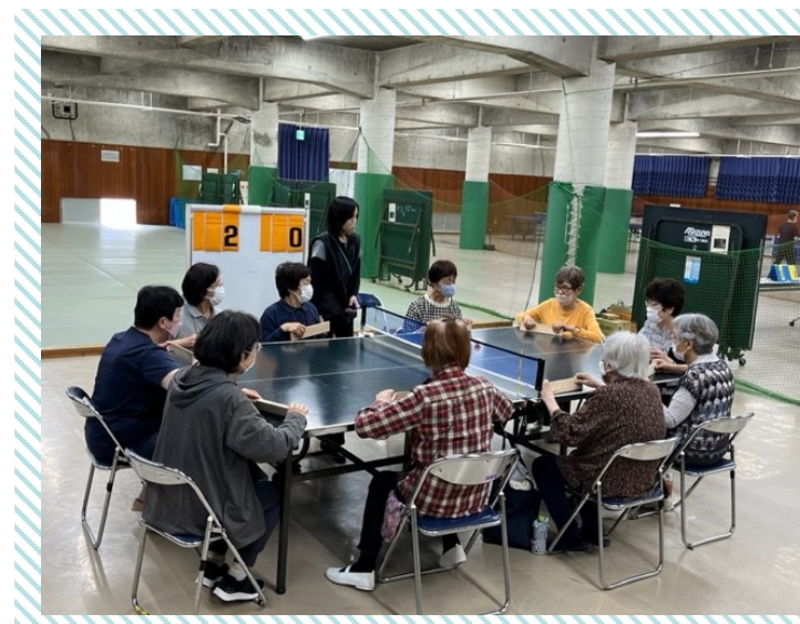
パラスポーツを楽しもう