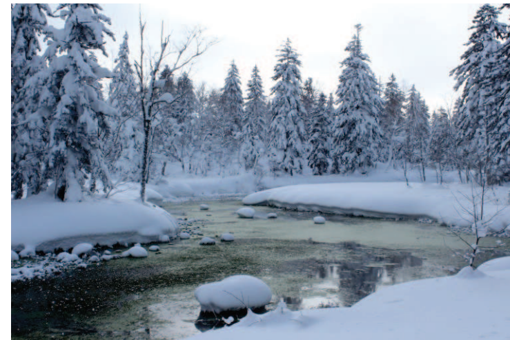
「カムイミントラ(神々の遊ぶ庭) 北海道大雪山の魅力 を写真で体感！」三川八恵