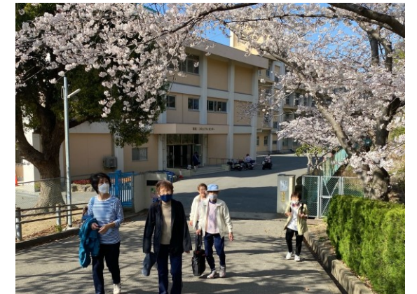
コミセンの入口の風景。季節によっていろいろな景色となっています。