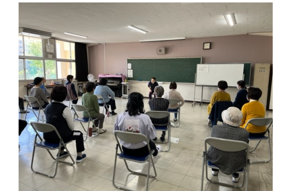
歌あり、軽い運動あり、会話あり、講師の先生とコミュニケーションを取りながら楽しく進んでいきます。