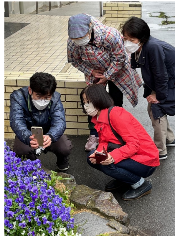
人気講座「ちょっといい写真の撮り方」の風景。先生の丁寧な指導で写真が上達します。