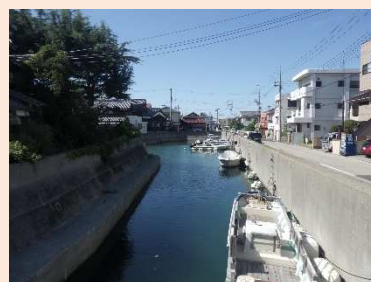
現在も残る船溜り