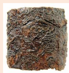
寺山古墳銀象嵌鳳凰