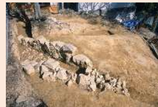
寺山古墳全景写真

発掘調査が終了後、石室は錦が丘中央公園の北東隅に移設して、現在地下に保存しています。2019年にはこの石室と出土物一括107点が明石市の指定文化財に指定されました。 (明石市文化・スポーツ室 稲原昭嘉)