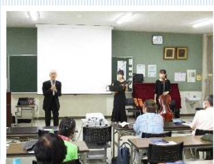
そうだったのか…管弦楽