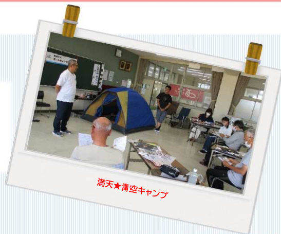
満天★青空キャンプ

毎回人気のおなじみの講座や、音楽、暮らしのお手伝い、体験型学習など さまざまな講座を開催しました。今後も皆さまに楽しんでいただける講座を たくさんご用意いたします。市民講座はどなたでもご参加いただけます。 ぜひ気軽にご参加ください。