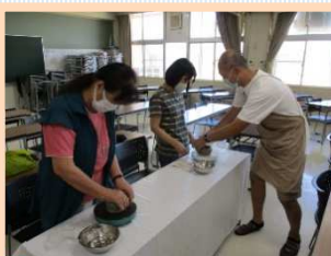
おとなの陶芸教室