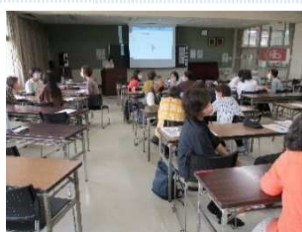
めざせスッキリ! がんばらない片づけのコツ