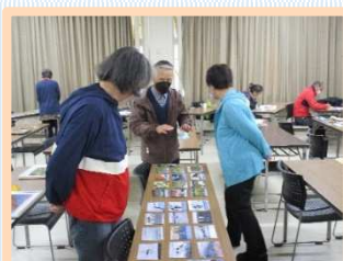
「カムイミントラ」大雪山の魅力を写真で体感!