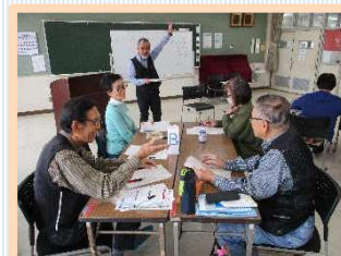
外国人に伝える! 伝わる やさしい日本語講座