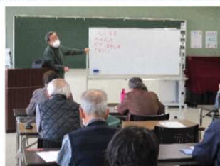
おいしい夏野菜の育て方教室