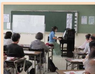
ジャズってどうなってるの?