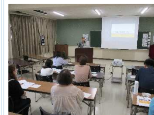
ワンコのいる生活