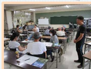
ゼロからはじめる登山・トレッキング講座