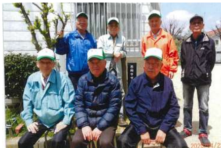
りょくじゅほうしょう 緑綬褒章とは？

発足して40周年、「継続」して活動に励んでこられた西岡サザンカ公園愛護会の皆さん。清掃活動に尽力するだけでなく、公園での防災訓練開催など、「地域の中心の場」として西岡サザンカ公園を守り続けてこられ、この度受章されました。誠にありがとうございます！